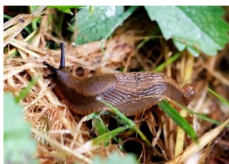
Nacktschnecke, Nahrung der Glühwürmchen-Larven

Infos zum Naturpark bei der Naturpark-Geschäftsstelle in Hermeskeil, Tel. 06503/9214-0, www.naturpark.org .